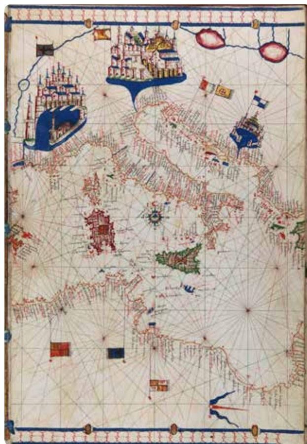
Russo, Jacopo Atlante nautico Ms., 16. sec (1521) Biblioteca Estense

ATLANTI L'esposizione presenta una ricca selezione degli esemplari più significativi di atlanti provenienti dalla collezione della biblioteca estense. La rassegna accompagna la mostra Meravigliose Avventure mettendo a fuoco le grandi scoperte geografiche e il brillante lavoro dei cartografi nel periodo di grandi esplorazioni europee dal Rinascimento alla fine del XVIII secolo.