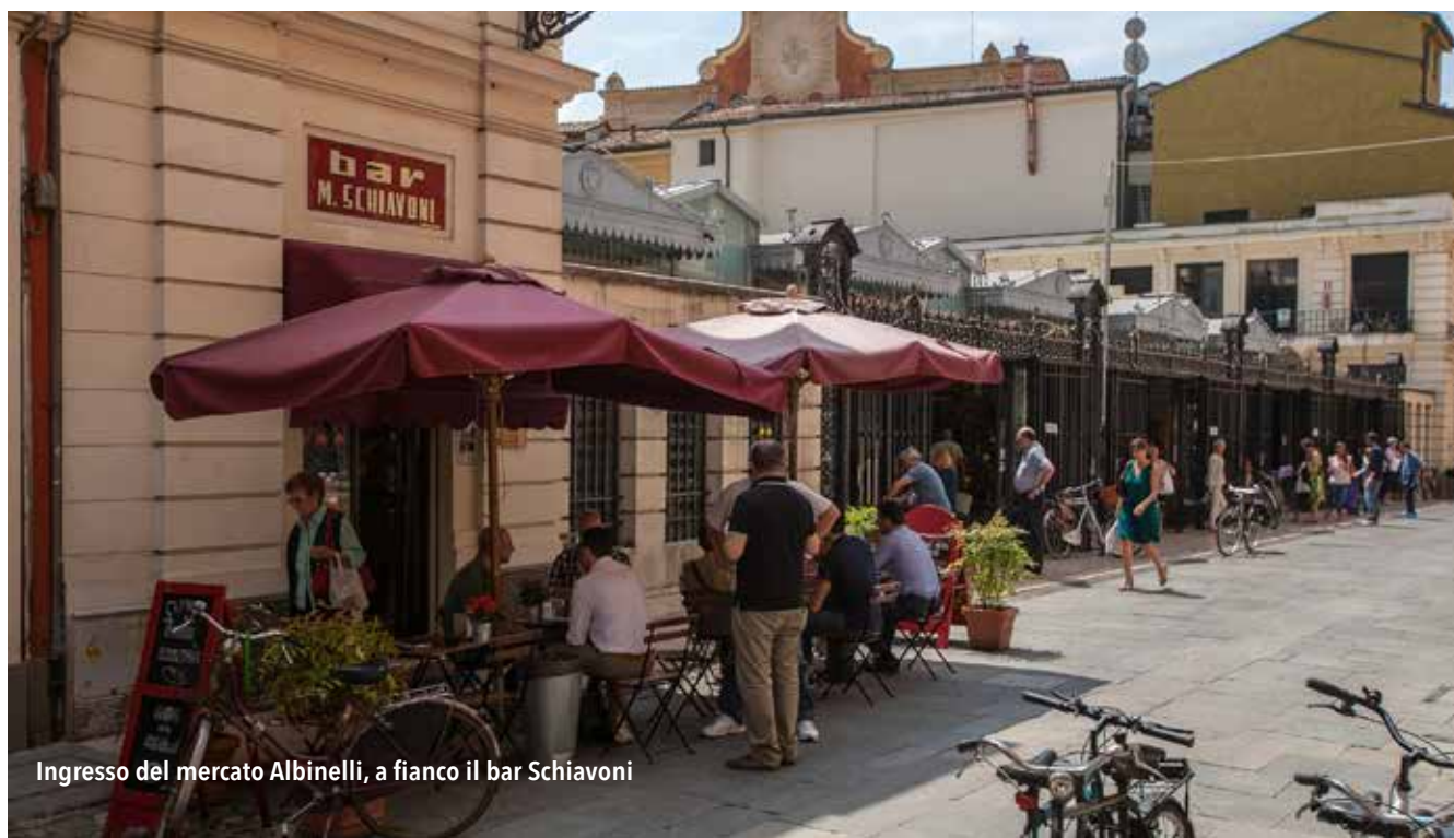
Ingresso del mercato Albinelli, a fianco il bar Schiavoni

Fino a dicembre 2018 Modena, Palazzo dei Musei, Galleria Estense EFFIGIE: L'ARTE DELLA MEDAGLIA Rassegna degli esempi più significativi di medaglie provenienti dalle raccolte estensi. La mostra celebra il lungo lavoro di catalogazione e restauro delle collezioni eseguito in collaborazione con la Fondazione Memofonte di Firenze.