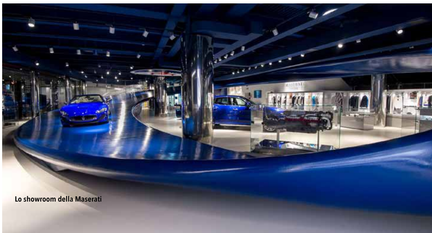
Lo showroom della Maserati

Fino al 28 gennaio 2018 Modena, Galleria Estense L'ALTRO RINASCIMENTO. MINIATURA EBRAICA NEL DUCATO ESTENSE Mostra-dossier dedicata all'eccezionale collezione di manoscritti miniati ebraici provenienti dalla biblioteca dei duchi d'Este.