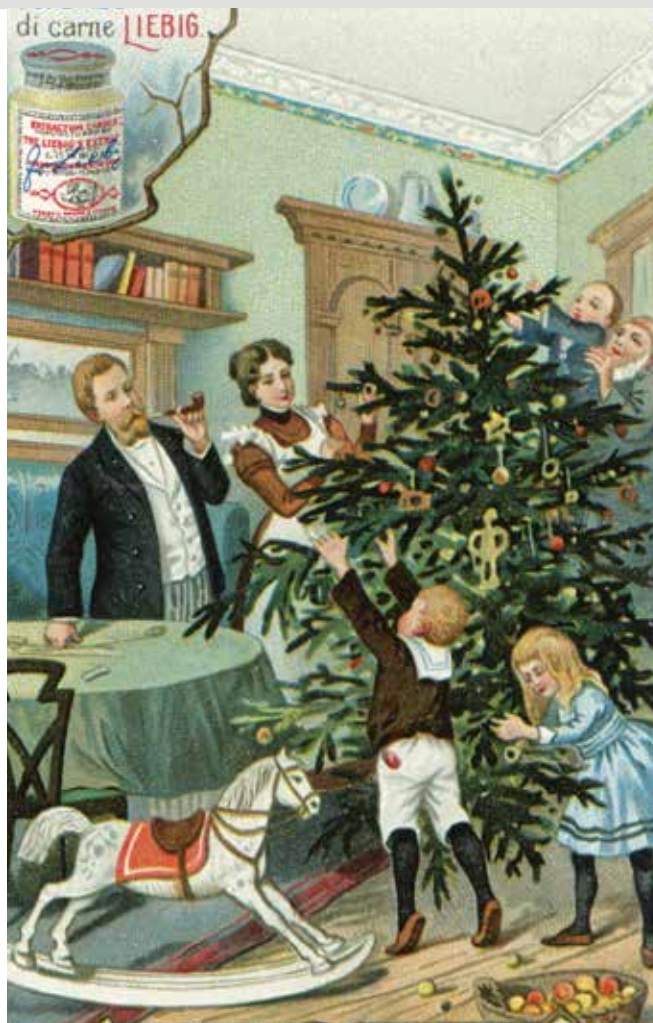
Figurina proveniente dal Museo della Figurina