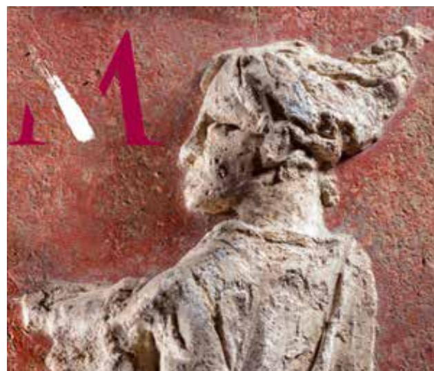
Frammento di affresco con rilievo in stucco da una lussuosa villa del suburbio di Mutina

A 2200 anni dalla fondazione della colonia romana di Mutina (183 a.C.) i Musei Civici di Modena presentano la mostra Mutina Splendidissima che illustra non solo l'origine e lo sviluppo della città romana, ma anche l'eredità che ha lasciato alla città medievale, moderna e contemporanea. Un ponte verso il futuro è rappresentato dalla time capsule che all'interno della mostra accoglierà i messaggi dei visitatori per i cittadini del 2099, quando la capsula verrà riaperta in occasione dei 1000 anni del Duomo cittadino.