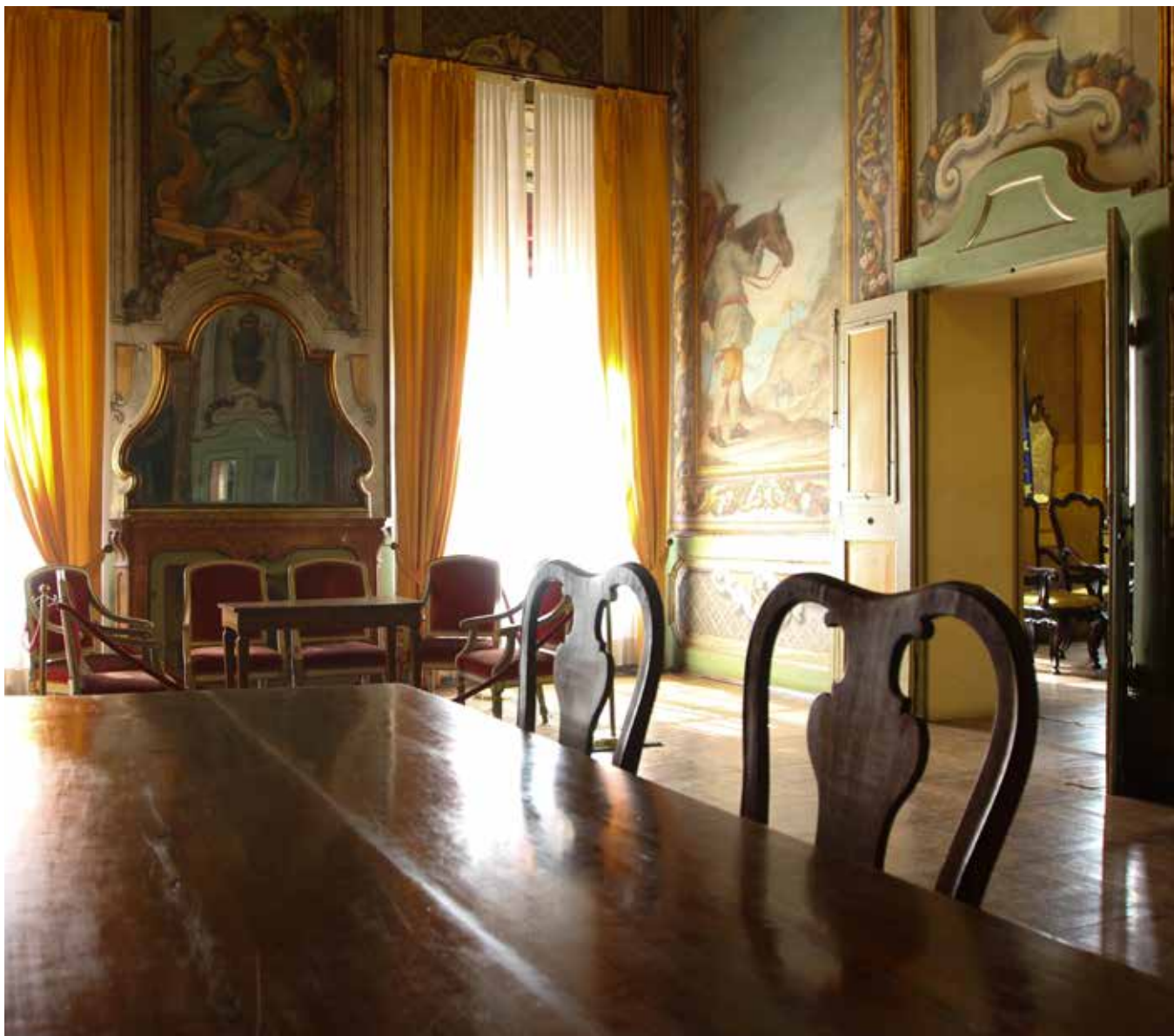
Palazzo comunale, sala degli Arazzi

Fiera antiquaria in cui esporranno antiquari ambulanti, artigiani restauratori e commercianti di antiquariato.