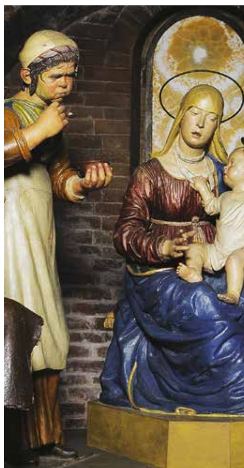
Particolare della Madonna della pappa di Guido Mazzoni

La Ferrari e le donne: una storia non raccontata