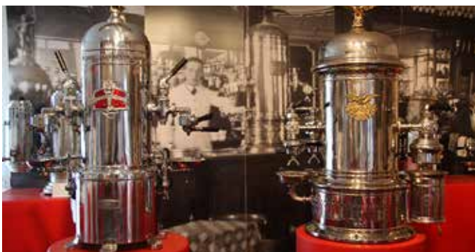
Museo "Le Macchine da Caffè" - Collezione Cagliari

Il museo riunisce oltre 120 esemplari di macchine per caffè espresso da bar di grande valore storico e stilistico, realizzate dal 1905 ad oggi.