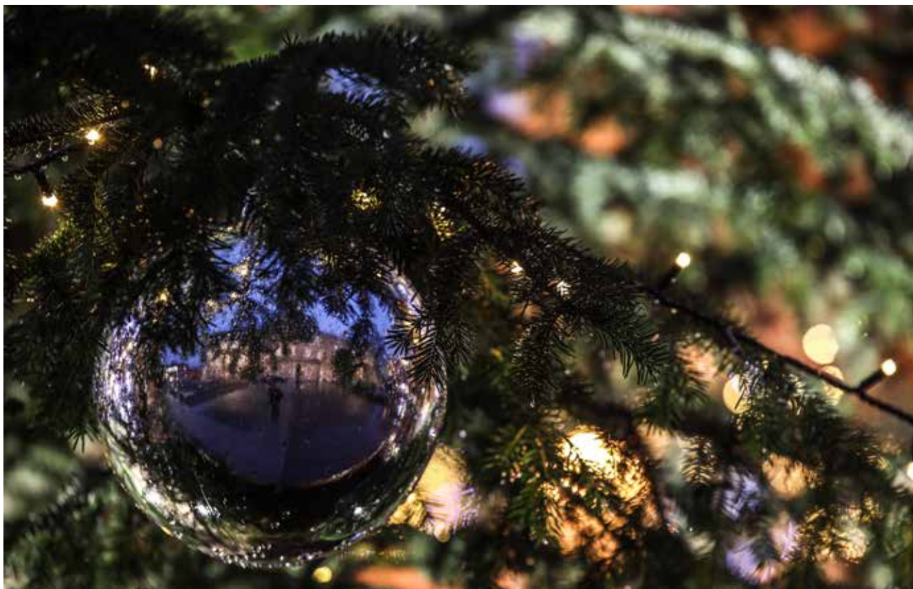
Palazzo Ducale riflesso in una palla di Natale